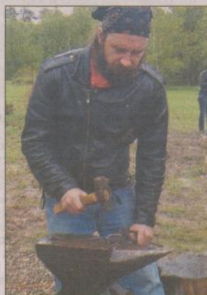
Кузнец: рождение красоты