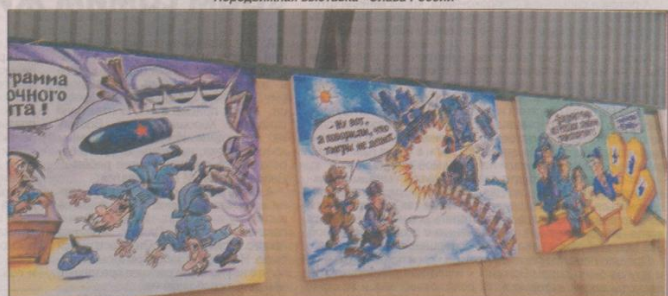
Выставка военных карикатур