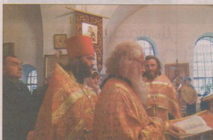
Молебен в скитском храме

В Битягове состоялось открытие Всероссийской поляны слётов